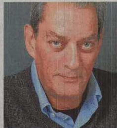
Paul Auster.