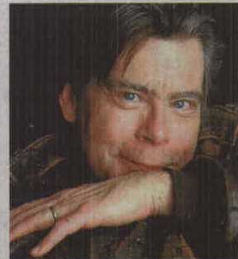
Stephen King.