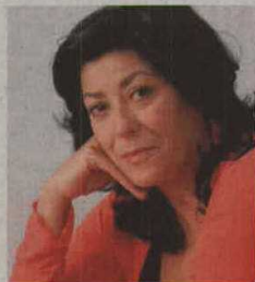
Almudena Grandes.